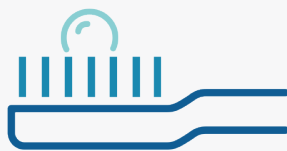
2 años y mayor = Tamaño de un guisante

Cada miembro de familia debe tener su propio cepillo de dientes.